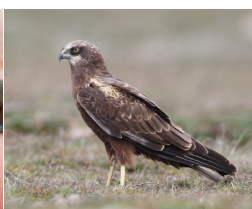
Busard des roseaux