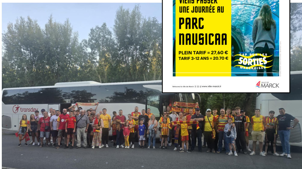
Une centaine de Marckois était au Stade Bollaert-Delelis le 9 août pour encourager le RC Lens face à Leipzig.

les enfants de 3 à 12 ans) . En décembre, direction le marché de Noël de Reims et les caves de Champagne le 13 décembre pour 40,20 € . Soyez à l'affût de l'ouverture des inscriptions dès début novembre.