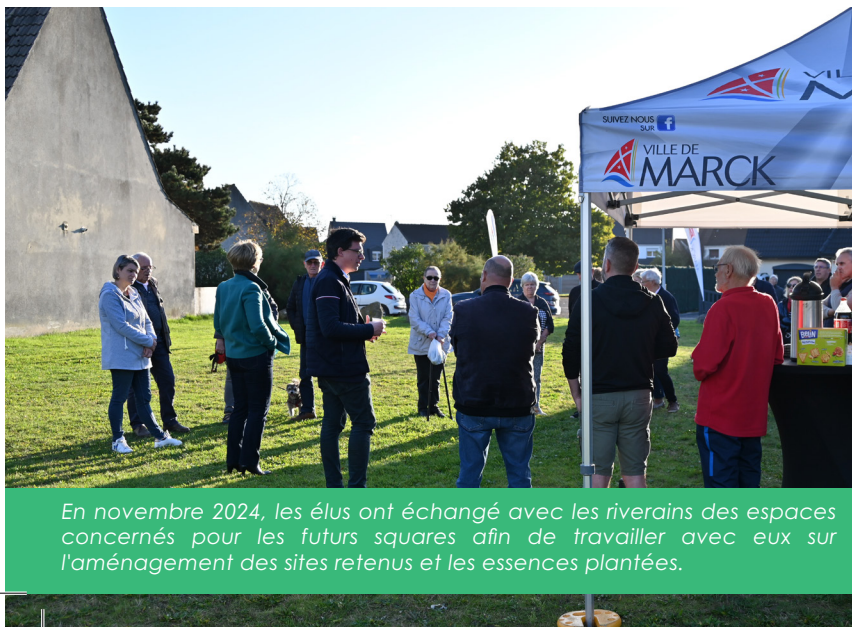
En novembre 2024, les élus ont échangé avec les riverains des espaces concernés pour les futurs squares afin de travailler avec eux sur l'aménagement des sites retenus et les essences plantées.

Depuis plus de dix ans, Marck agit pour développer et réintroduire la biodiversité dans ces espaces verts et plus largement en ville. Avec le « Plan squares » et l'opération « Un arbre, une naissance », nous franchissons une nouvelle étape. En plantant arbres et arbustes, nous renforçons la biodiversité, protégeons les sols et offrons des îlots de fraîcheur pour tous. Conçus avec les habitants, ces espaces deviendront des lieux de vie sécurisés et ô combien utiles pour les plus vulnérables en cas de fortes chaleurs. Le développement de la biodiversité dans les sols permettra également une meilleure infiltration de l'eau lors des épisodes de fortes pluies.